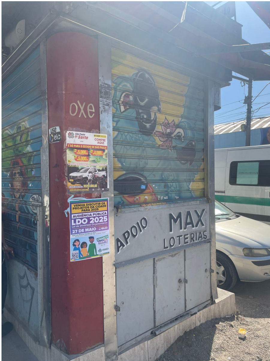
Cartaz na banca de jornal na região do CEU José Saramago