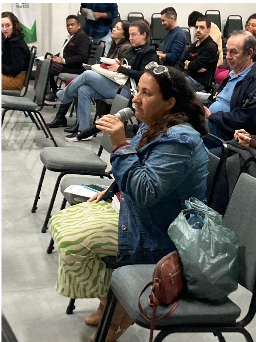
Fala de participantes, questionamentos e comentários.