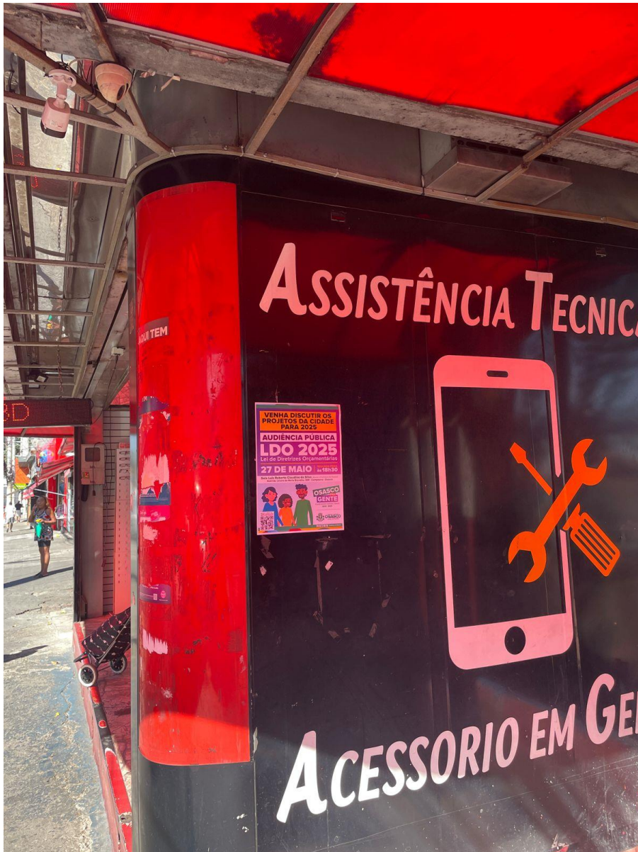
Cartaz na banca de jornal na região do CEU José Saramago