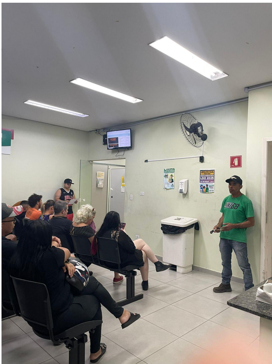
Cartaz no Pronto Socorro do Rochdale