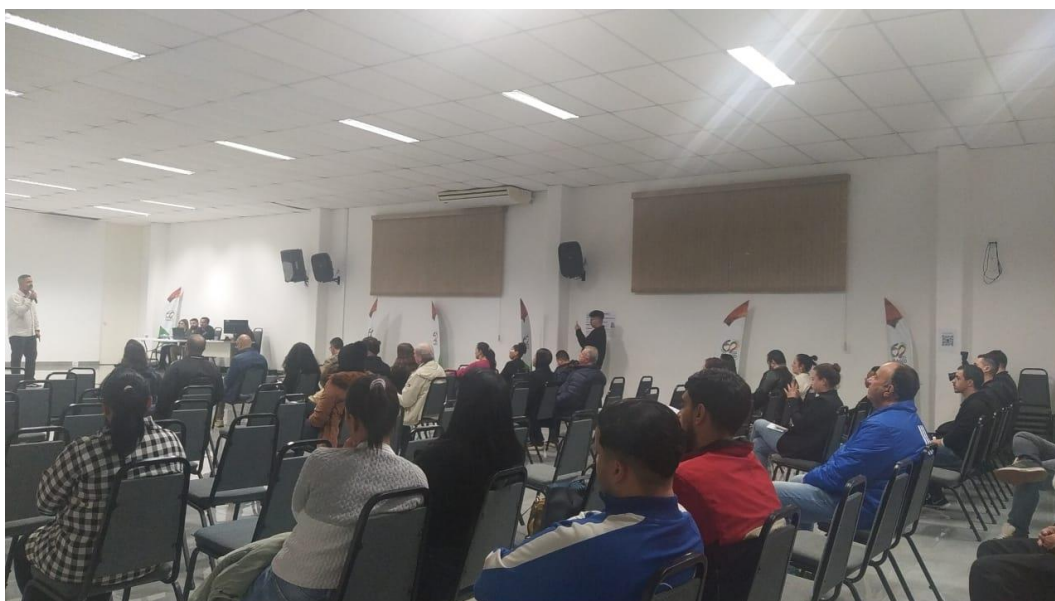
Participantes na Audiência Pública.