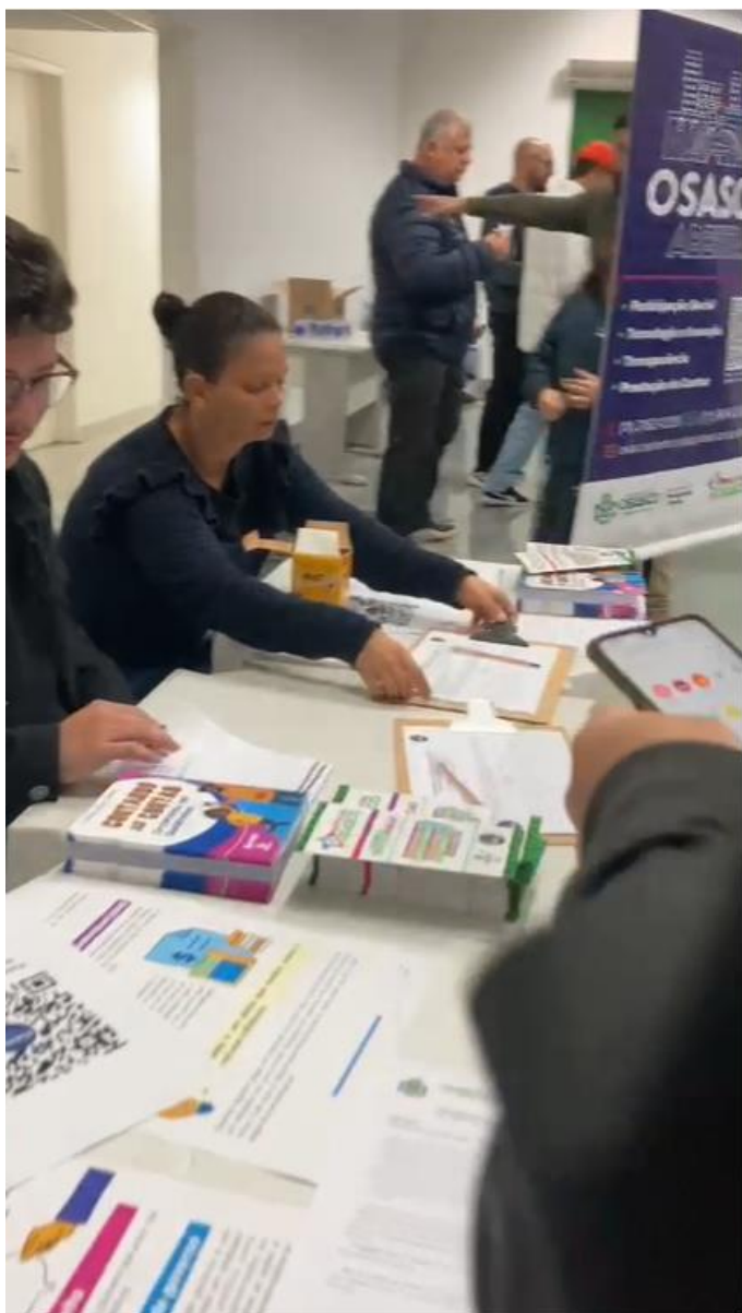
Mesa de recepção, boas vindas e registro na lista de presença.