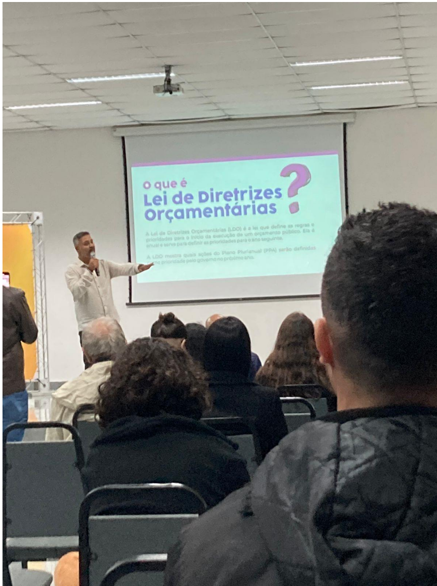
Apresentação LDO 2025.