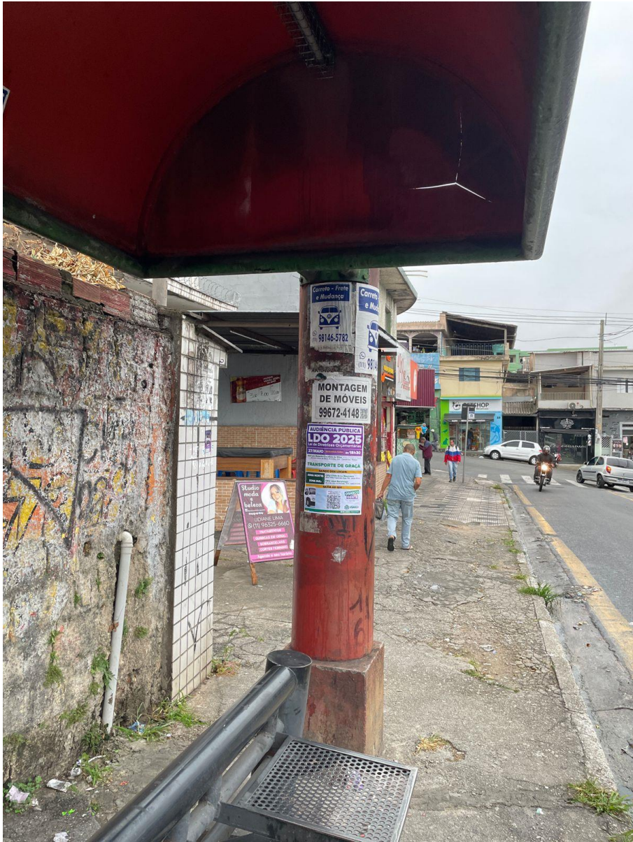
Cartaz no ponto de ônibus na região do CEU Zilda Arns