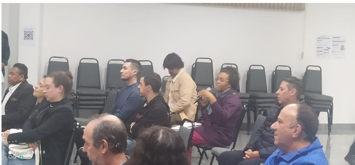
Fala de participantes, questionamentos e comentários.