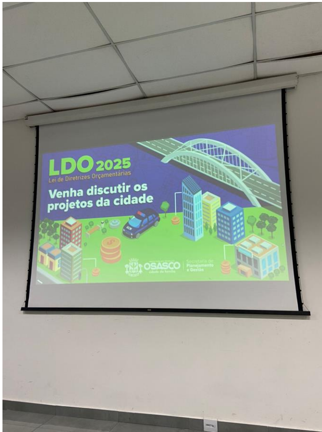
Apresentação LDO 2025.