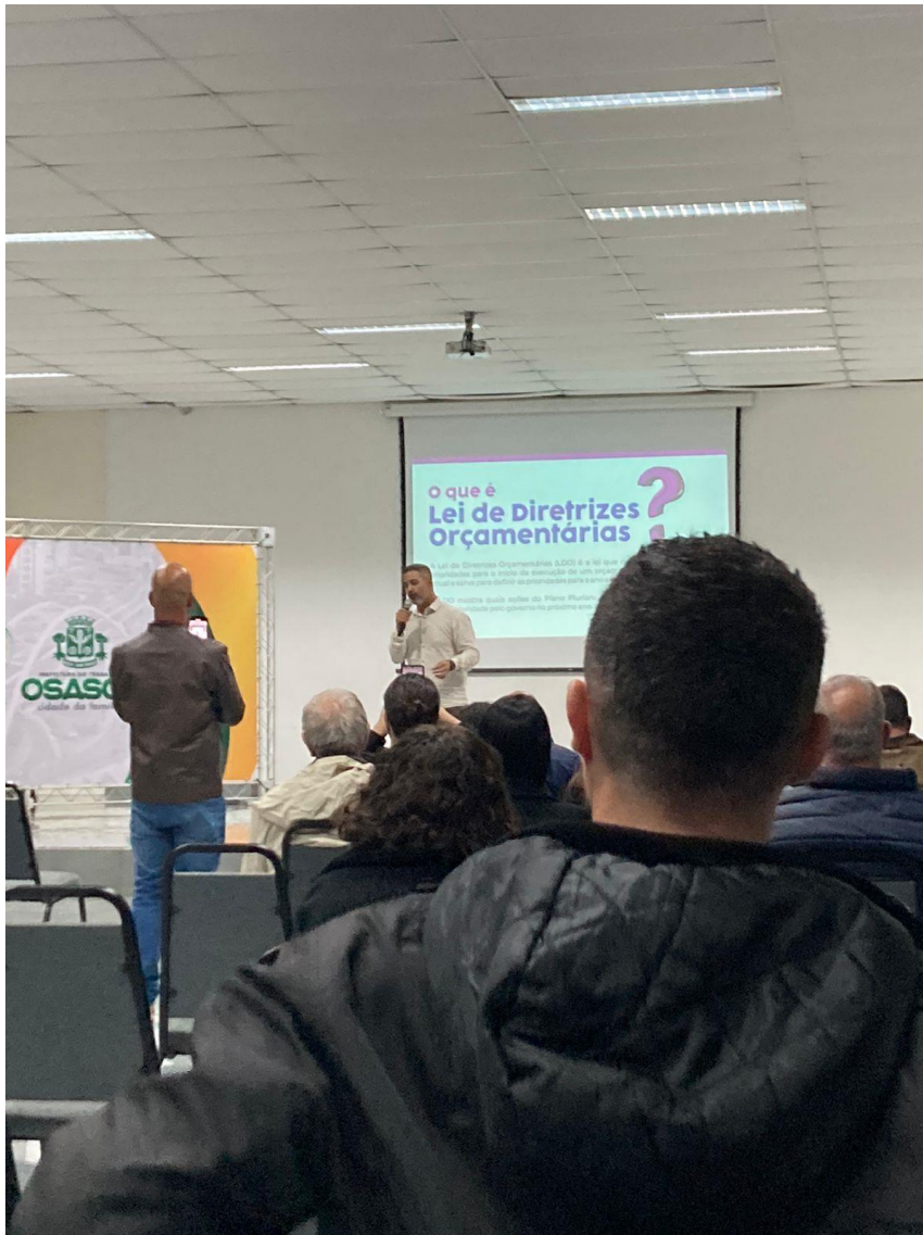
Apresentação LDO 2025.