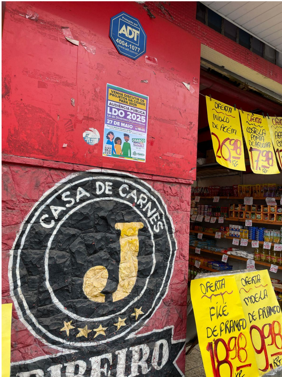
Cartaz no comércio na região do CEU José Saramago