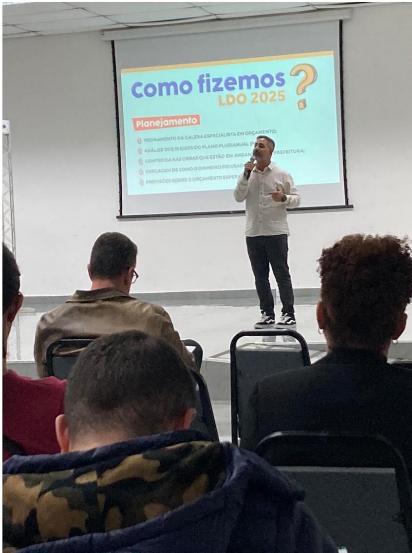
Apresentação LDO 2025.