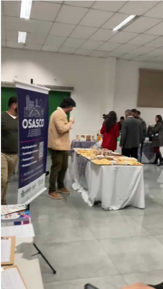
Mesa de Coffee Break.