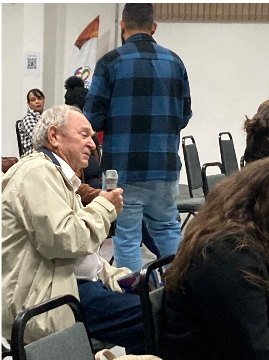
Fala de participantes, questionamentos e comentários.