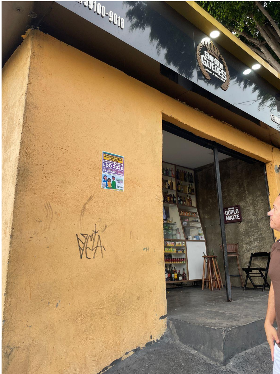
Cartaz no comércio ao redor do CEU José Saramago