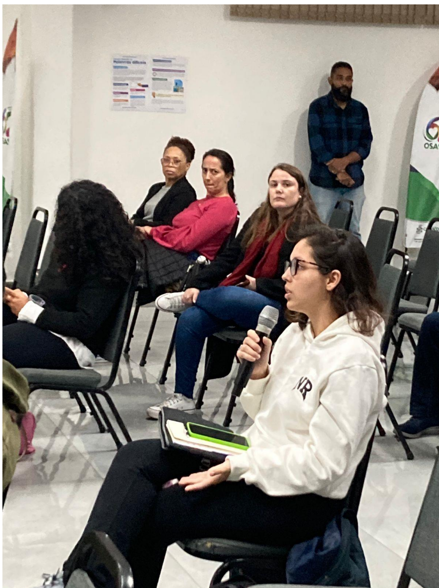
Fala de participantes, questionamentos e comentários.