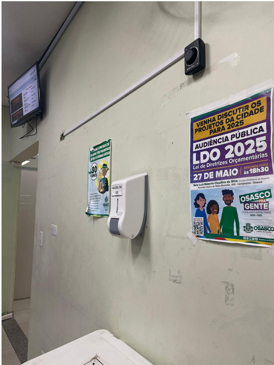
Cartaz no Pronto Socorro do Rochdale