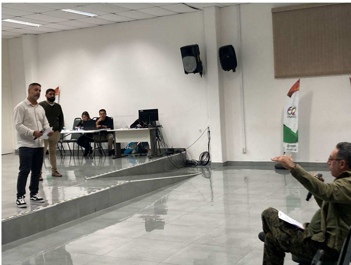
Fala de participantes, questionamentos e comentários.