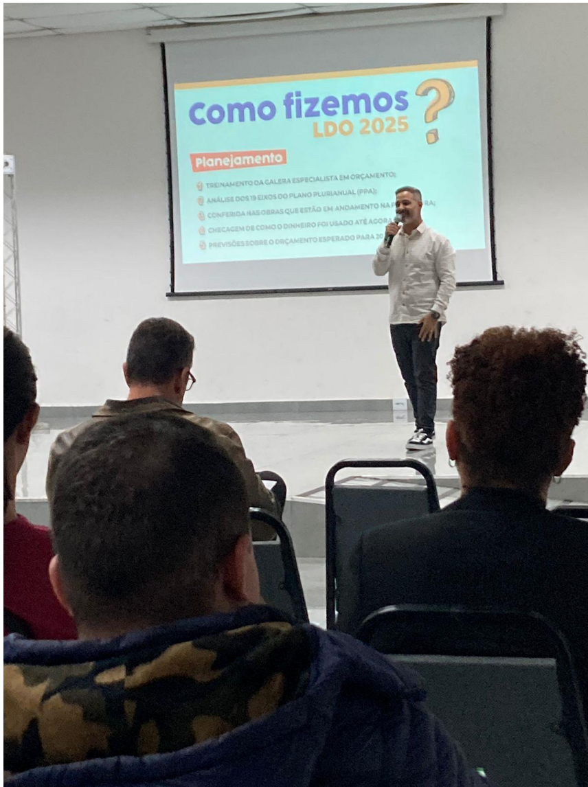
Apresentação LDO 2025.