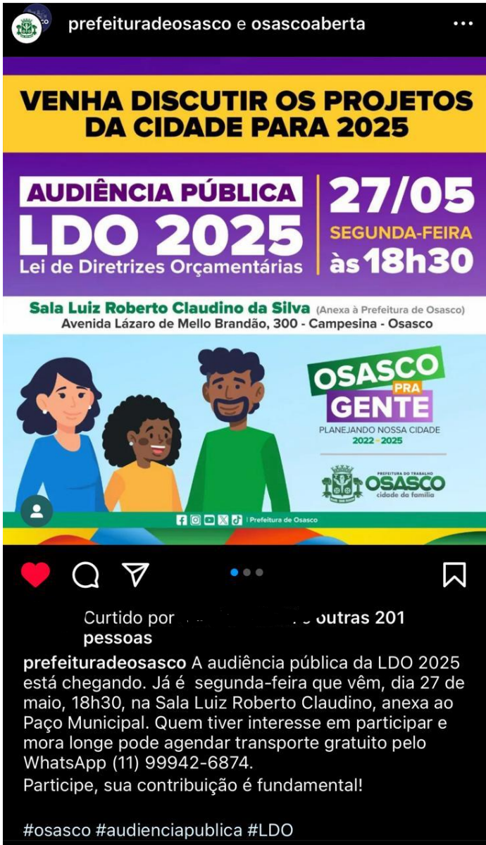
Divulgação no Instagram da Prefeitura de Osasco colab com Osasco Aberta