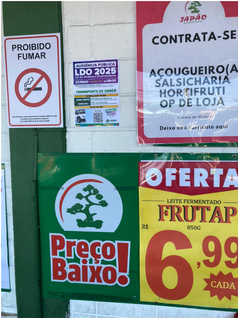
Cartaz no supermercado Japão