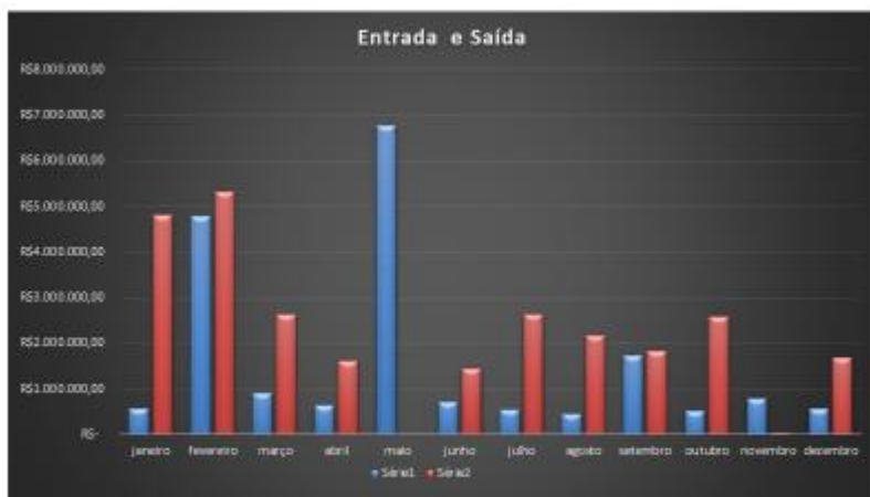
* ENTRADA E SAÍDA DOS VALORES